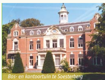
Bos- en kantoortuin te Soesterberg

Bij boomverzorging komt heel wat kijken. En op elk (deel) traject kunnen wij u met onze deskundigheid van dienst zijn. Het mag voor zichzelf spreken dat we in staat zijn bomen te planten, te onderhouden en, indien nodig, te vellen. Bodemonderzoek te doen of uw bomenbestand in kaart te brengen, compleet met een overzicht van de toestand van elke boom. Maar onze kennis gaat veel verder.