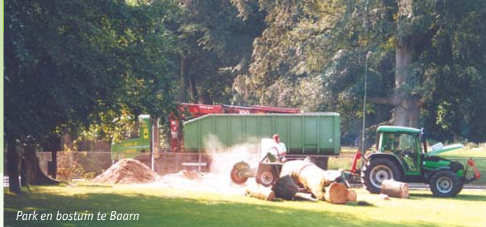
Park en bostuin te Baarn

Internet: www.flora-nova.nl E-mail: info@flora-nova.nl