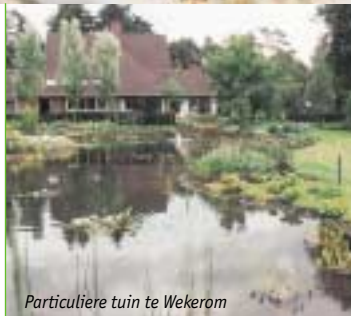
Particuliere tuin te Wekerom

Een niet te onderschatten factor bij het vormgeven van een groenvoorziening is het onderhoud. Maaien, schoffelen en snoeien zijn nu eenmaal inherent aan het beheer van een tuin of parkachtig terrein. De mate en frequentie waarin die werkzaamheden uitgevoerd moeten worden, bepaalt u met uw keuze voor een tuinontwerp echter voor een groot deel zélf.