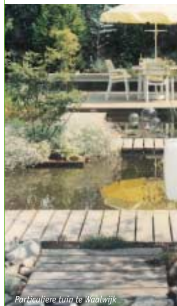
Particuliere tuin te Waalwijk

Bent u benieuwd naar ontwerpsuggesties voor uw bedrijfspand of woning? Laat Flora Nova u eens de mogelijkheden schetsen!