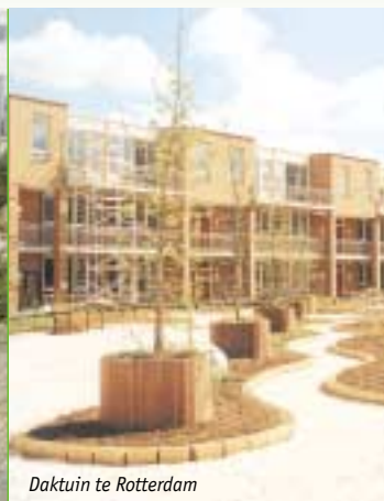
Daktuin te Rotterdam