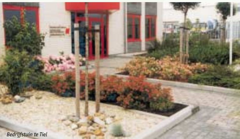
Bedrijfstuin te Tiel

E E N O N T W E R P D A T B I J U P A S T ook qua budget